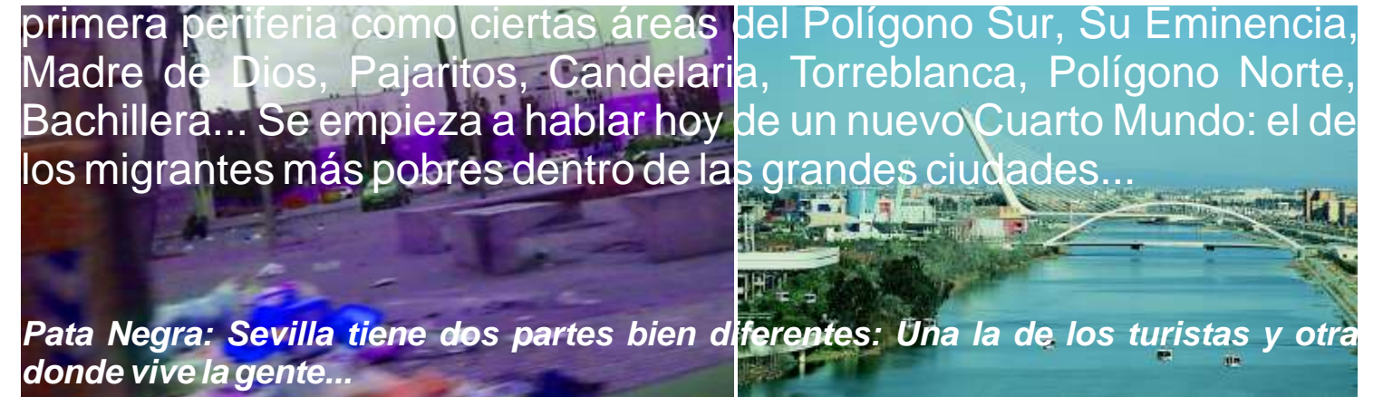
Pata Negra: Sevilla tiene dos partes bien diferentes: Una la de los turistas y otra donde vive la gente...