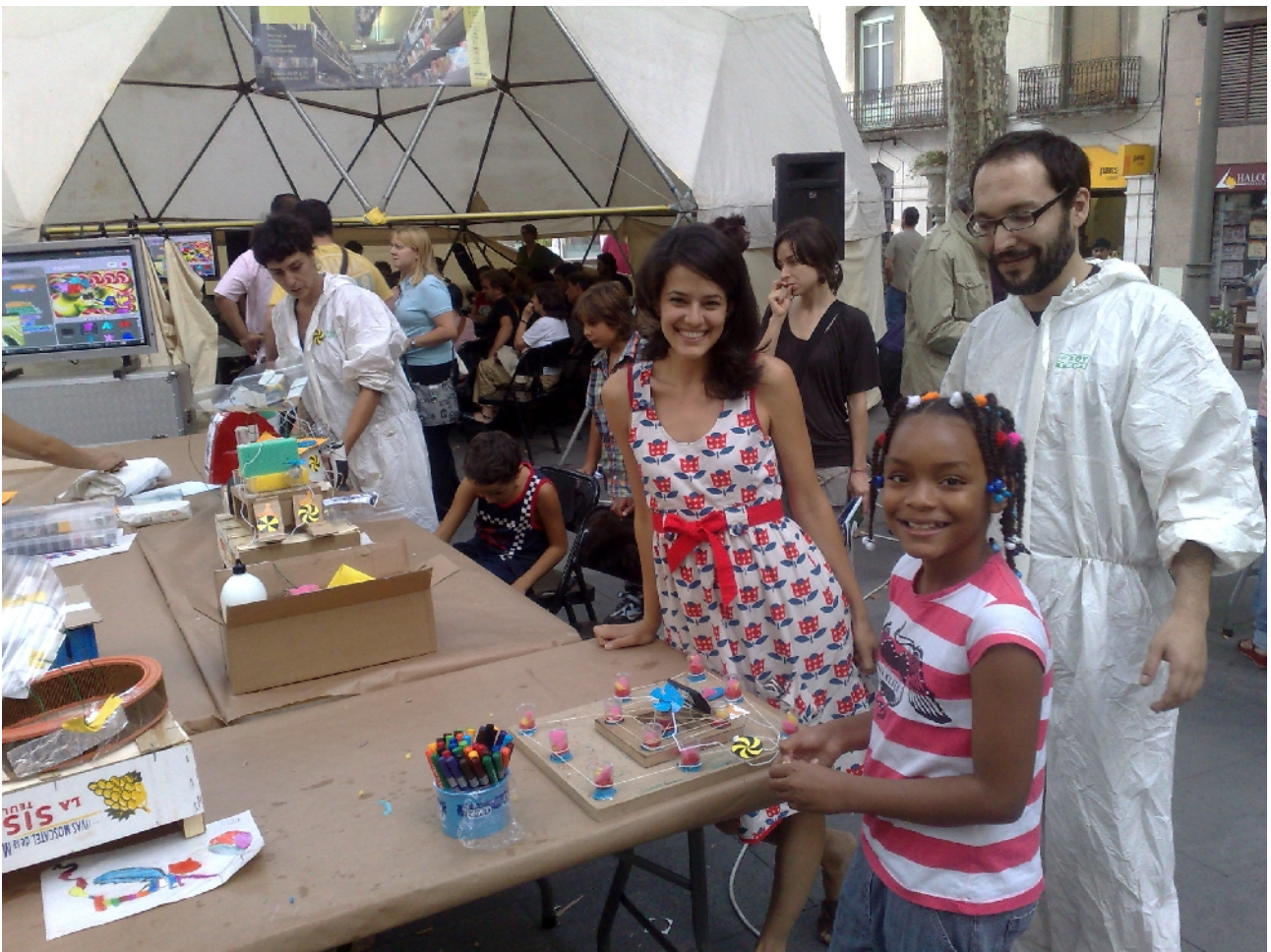
Hackitectura.net y colaboradores, 2009, Wikiplaza Figueres

¿Cual sería la diferencia en este escenario entre una práctica artística y un movimiento social experimental, un centro social de nueva generación o un proyecto hacker? No mucha. Seguramente su capacidad de conectarse con la historia del arte y la cultura, la especificidad de algunas de sus herramientas, los lenguajes utilizados, el énfasis de sus protagonistas en la creación, la pasión por el juego, lo anómalo, la ficción, la paradoja, el placer, la permanente desterritorialización; en última instancia, la propia percepción como artistas de aquellos que las llevan a cabo.